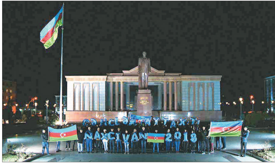
Gənclər Paytaxtı Naxçıvan – 2018

Bəli, bu gün inamla deyə bilərik ki, bizim güclü liderimiz, güclü ölkəmiz, Vətənimiz, yetişməkdə olan sağlam və güclü gəncliyimiz var.